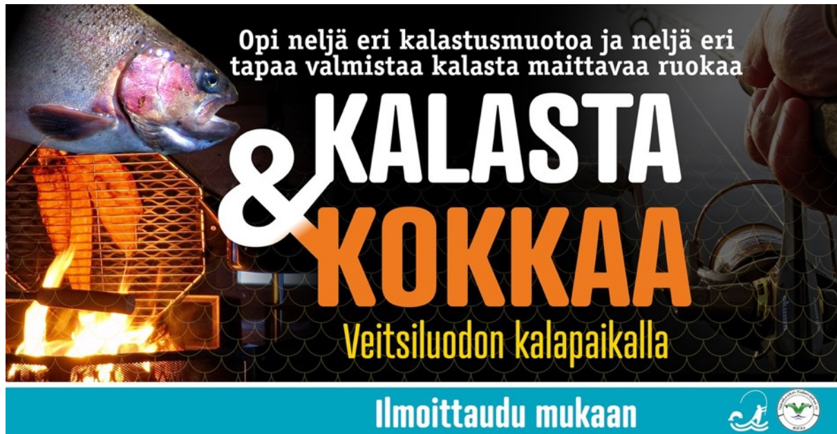
Kuva 2: esimerkki visuaalisesta tapahtumailmoituksesta

Alla olevasta esimerkistä tulee hyvin ilmi tärkeitä seikkoja tapahtumasta yhdellä silmäyksellä: kirjolohen kuva viittaa, että ollaan kalastuksen äärellä, loimukuva viittaa ruoan valmistukseen, tapahtuman nimi ”kalasta ja kokkaa” kertoo ytimekkäästi mistä on kyse, tapahtumapaikka on ilmoitettu selvästi, tapahtumassa tutustutaan neljään eri kalastusmuotoon ja opitaan neljä eri tapaa valmistaa kalasta maittavaa ruokaa, tapahtumaan pitää ilmoittautua etukäteen. Järjestävät tulevat esille logojen muodossa.